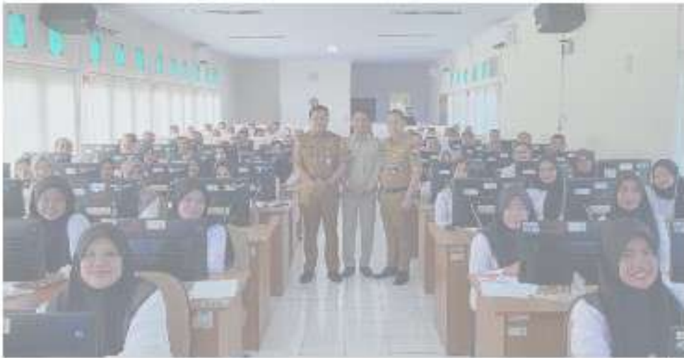
Kepala BKD Provinsi Jambi, Kepala UPT BKN Jambi Kantor Regional VII Palembang, Kepala Bidang Pengembangan Aparatur BKD Provinsi Jambi beserta peserta