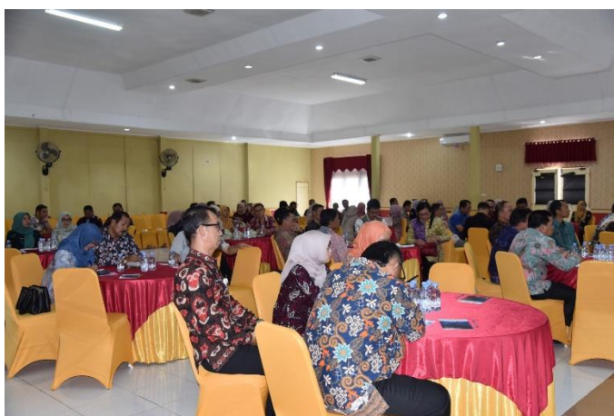
Dinas Kominfo Provinsi Jambi menyelenggarakan Focus Group Discussion (FGD) PPID pada 27 Juli 2023 bertempat di Aula Hotel Sutis, Kota Sungai Penuh