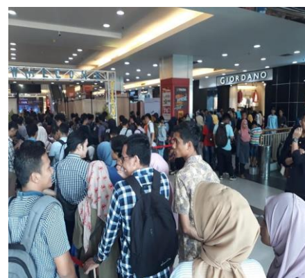
Gambar 3 dan 4. Antrian Para Pencari Kerja di Hari Pertama dan Kedua