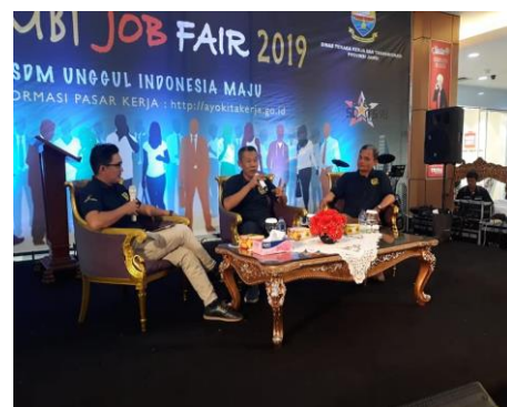
Gambar 6. Sesi Talkshow

Berharap dengan Diadakannya Jambi Jobfair 2019 Ini Mampu Mengurangi Angka Pengangguran di Indonesia Pada Umumnya dan di Provinsi Jambi Pada Khususnya. Serta Memberikan Peluang Kerja yang Baik untuk Para Fresh Graduated Maupun yang Sudah Berpengalaman. (DS)