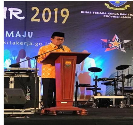
Gambar 2. Gubernur Jambi Menutup Acara Jobfair