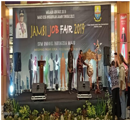
Gambar 1. Asisten II Setda Prov.Jambi Membuka Acara Jobfair