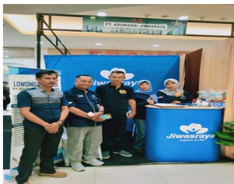
Gambar 5. Salah Satu Stand Jobfair 2019

Selama 3 hari Jobfair berlangsung pencari kerja dan pengunjung stand dihibur oleh penampilan Artis, Band dan DJ ternama Provinsi Jambi. Selain itu di hari kedua Jobfair diadakannya Talkshow Session seputar dunia kerja dan di hari ketiga penghujung acara diadakannya pula CAREER TALK dengan tema "Job Seeker, Job Maker". Kerja sama Dinas Tenaga Kerja dan Transmigrasi Provinsi Jambi dengan Pusat Karir STIE Muhammadiyah Jambi.