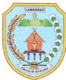
DAFTAR PENERIMA DAN RINCIAN HIBAH KAPUR PERTANIAN KEPADA KELOMPOK TANI DI KABUPATEN LAMANDAU TAHUN ANGGARAN 2024