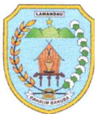
DAFTAR PENERIMA HIBAH BIBIT/BENIH SAYUR SAYURAN KEPADA KELOMPOK TANI DI KABUPATEN LAMANDAU TAHUN ANGGARAN 2024