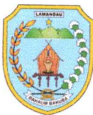
DAFTAR PENERIMA HIBAH BIBIT DURIAN KEPADA KELOMPOK TANI DI KABUPATEN LAMANDAU TAHUN ANGGARAN 2024