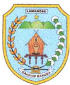
DAFTAR PENERIMA HIBAH BANTUAN PAKET BUDIDAYA IKAN KOLAM TERPAL DESA SUMBER JAYA TAHUN ANGGARAN 2024