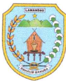
DAFTAR PENERIMA HIBAH BIBIT TANAMAN BUAH-BUAHAN KEPADA KELOMPOK TANI DI KABUPATEN LAMANDAU TAHUN ANGGARAN 2024