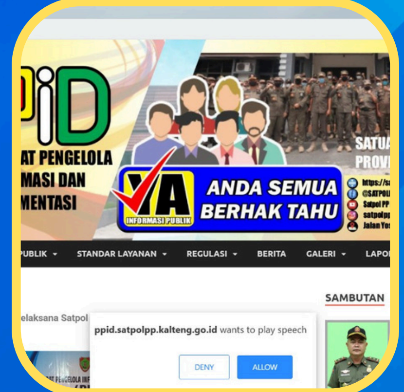
Fitur Text to Voice Membacakan Informasi Secara Otomatis

Sebagai bentuk komitmen terhadap pelayanan inklusif, Satpol PP Provinsi Kalimantan Tengah menyediakan akses jalan ramah disabilitas di lingkungan kantornya. Fasilitas ini dilengkapi dengan marka khusus dan jalur pembatas yang jelas untuk memudahkan penyandang disabilitas. Selain itu, petugas juga siap membantu secara langsung guna memastikan pelayanan yang setara bagi seluruh masyarakat, termasuk penyandang disabilitas.