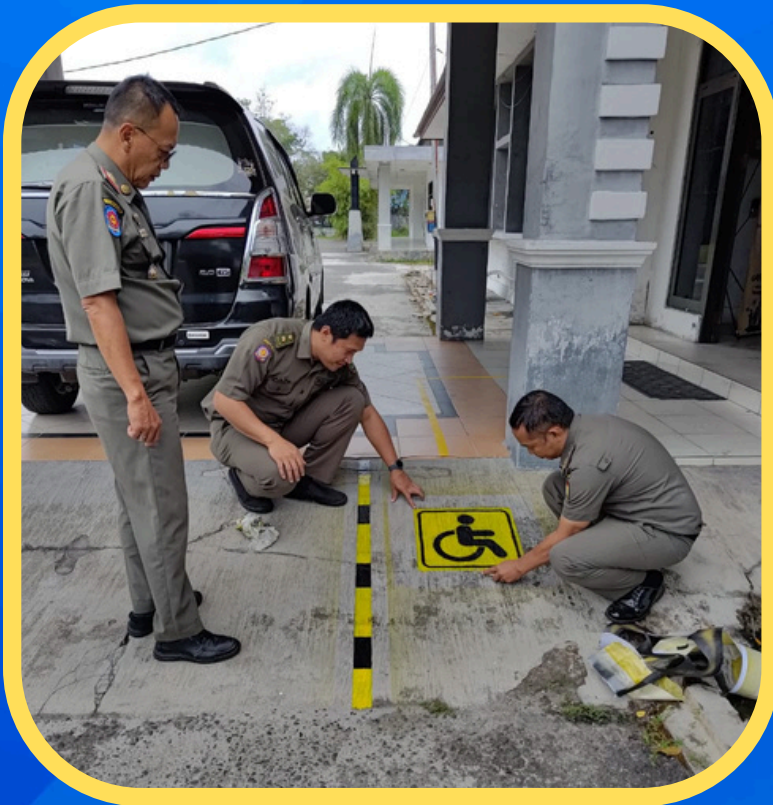
Akses Jalan Khusus yang Dilengkapi Marka Petunjuk Visual yang Jelas