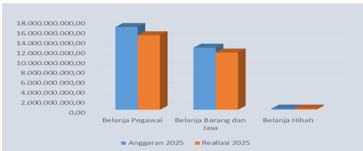
Grafik 5.2 Anggaran dan Realisasi Belanja Operasi TA 2025