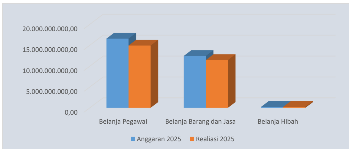
Grafik 5.2 Anggaran dan Realisasi Belanja Operasi TA 2025